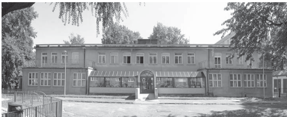
Už pohled na průčelí domu na Petřinách prozrazuje, že rekonstrukce je nezbytná.

Po téměř dvaceti letech provozu potřebuje objekt na Petřinách stavební a dispoziční úpravy. Ty by měly zajistit splnění současných požadavků na rozsah a standard poskytovaných služeb, což je za dnešního stavu obtížné. V současné době jsou pokoje klientů vícelůžkové, často z dispozičních důvodů průchozí. Úpravu vyžaduje i sanitární vybavení obytné části. Rovněž provozní zázemí budovy je prostorově stísněné a dochází ke křížení provozů. Rekonstrukci vyžaduje kuchyně a prádelna, doplnit je třeba šatny a sociální zázemí pro zaměstnance. Vnější plášť budovy by měl být kompletně opraven i z hlediska splnění nároků na sníženou energetickou náročnost provozu.