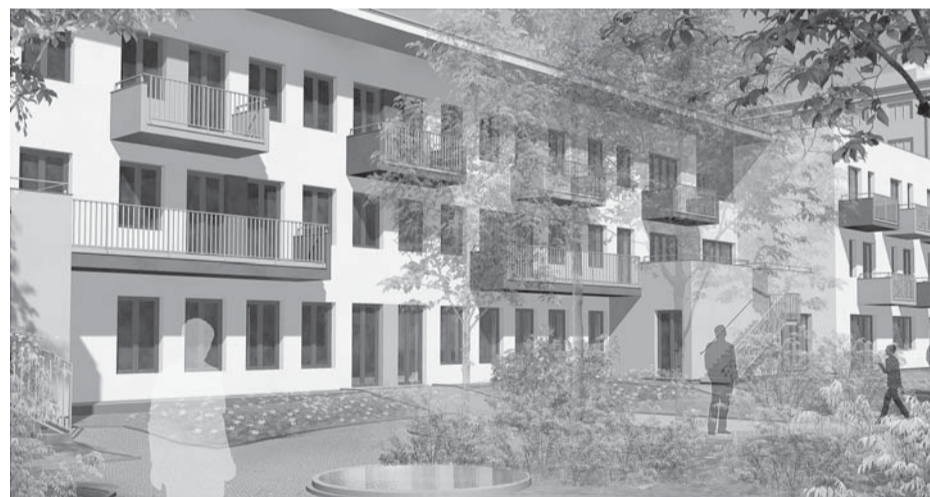
...a nakonec naznačení úprav okolního terénu.