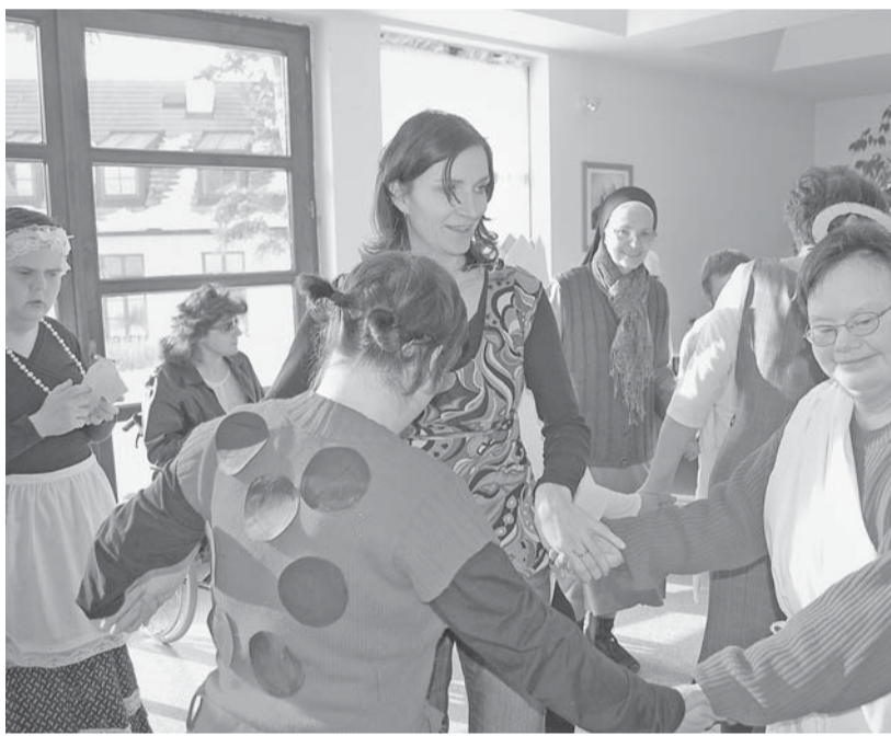
V Domově se najde i prostor pro společnou zábavu.

Některé části dne mají klienti samozřejmě neměnné – jako například ranní hygienu a snídani, v rámci takzvaného aktivizačního dopoledního programu se jim už ale aktivity mění. Někteří tráví dopoledne v rámci svého oddělení více oddychovými aktivitami, mnoho klientů ale míří každé dopoledne do terapeutických dílen. V nich mají k dispozici počítače, keramickou dílnu, dřevodílnu, mohou si uplést košíky nebo vytvořit výrobky nejrůznějšího druhu. „Vždy se pro každého klienta snažíme najít takovou práci, kterou je schopen zvládnout. Cílem není samotný výrobek, ale spíše práce, která je především