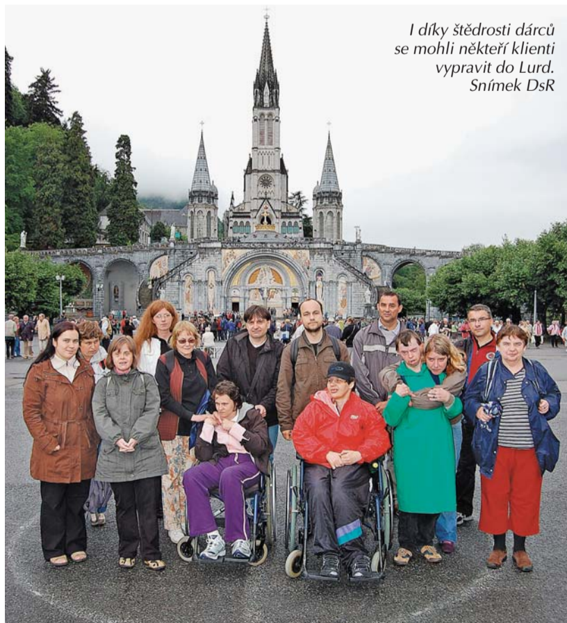
I díky štědrosti dárců se mohli někteří klienti vypravit do Lurd.

Nejen že jsem všechny povinnosti stihla i přesto, že jsem šla otevřít dveře někomu, komu jsem podsouvala své nepravdivé do-