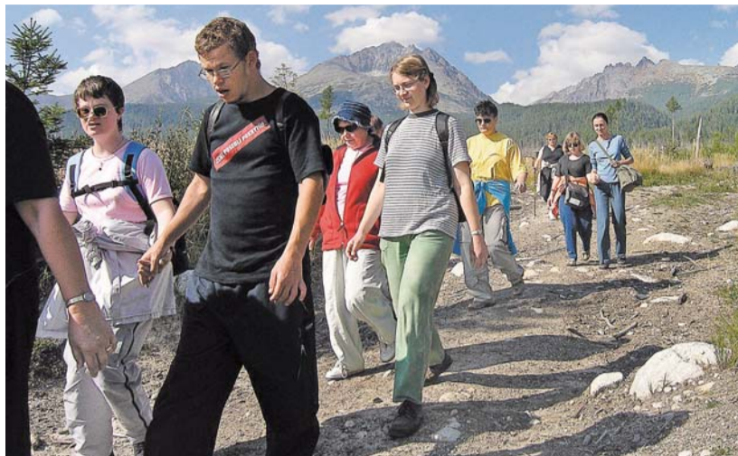
I díky Nadaci mají klienti šanci vyrazit na rekreaci – třeba do Tater.

Název „Nadace sestry Akvinely“ určili rodiče a přátelé Domova. „Měli jsme možnost sledovat sestru Akvinelu při budování Domova, její získávání a poctivé využívání finančních prostředků. Proto jsme sestru požádali, zda může nadace nést její jméno,“ vysvětlili později svou volbu. První správní a dozorcí radu vybírala sestra Akvinela. Měla velmi šťastnou ruku. Složení obou rad je velice stabilní a většina členů pracuje v Nadaci od jejího založení. V současné době působí