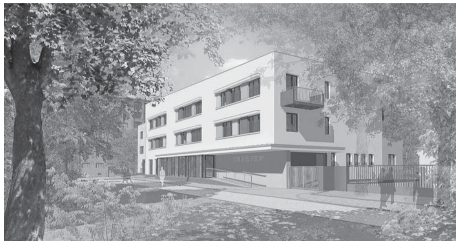
Vítězný návrh rekonstrukce domu na Petřinách...

Technické zázemí tvoří ordinace, kuchyně s jídelnou, sklady, prádelna, žehlárna, dílna a garáž. Kuchyně s jídelnou jsou v bezprostřední blízkosti prádelny, sušárny a žehlárny. Jídelna je v suterénu, s malými okny pod úrovní chodníku. Dílna je prostorově malá. Kapacita Domova je 33 lůžek.