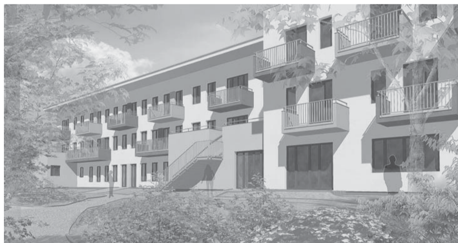
...zde je vidět detail oken a balkonů...