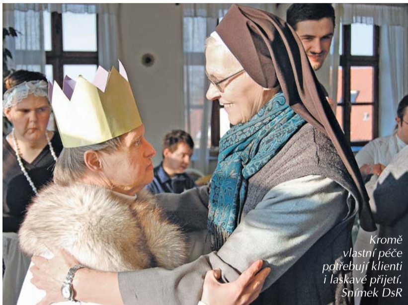
Kromě vlastní péče potřebují klienti i laskavé přijetí.

Nedílnou součástí každodenního života v Domově je jeho duchovní rozměr, který